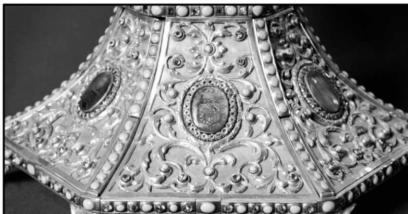
Fig.11 a. Detalle del pie Custodia del convento de la Purísima de monjas agustinas recoletas de Salamanca. ¿Italiana? Arxiu Mas Fundació Institut Amatller d'Art Hispànic