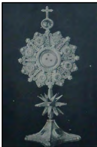
Fig.9 Custodia de Carlos II. EL Escorial (desaparecida desde 1942)

En 1690 la reina madre Mariana de Austria no pudo asistir al Escorial a la ceremonia del traslado definitivo de la Sagrada Forma y regaló una extraordinaria lámpara de oro, con filigrana de plata y pedrería, sostenida por el águila bicéfala coronada. La lámpara, destinada al interior del camarín reforzaría la iconografía habsbúrgica. 68 (fig. 10) La propuesta de esta hipótesis es que el cuerpo de esta lámpara formó parte del regalo indiano dividido en piezas: el águila convertida en lámpara, quedó en la sacristía de El Escorial.