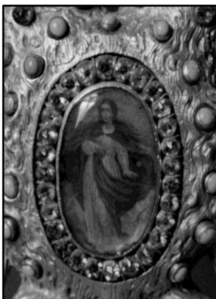
Fig.12 Custodia del convento de la Purísima de monjas agustinas recoletas de Salamanca. ¿Italiana? Detalle. (detalle)