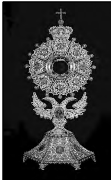
Fig.6 Custodia del convento de la Purísima de monjas agustinas recoletas de Salamanca. ¿Italiana?