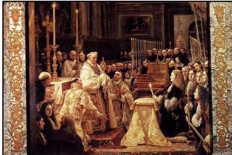
Fig.8 Claudio Coello. Detalle de La adoración de Carlos II ante la Sagrada Forma, 1685. Sacristía de San Lorenzo de El Escorial.