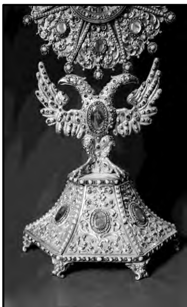
Fig.11 Custodia del convento de la Purísima de monjas agustinas recoletas de Salamanca. ¿Italiana? (detalle)

En torno al viril del ostensorio salmantino se observan las letras del apellido MONTEREI; el escudo de la familia en el centro de la base y los retratos de los patronos. Como no he logrado acceder al archivo del convento de Salamanca, por el momento solo puedo utilizar como herramienta de análisis el estilo de la pieza y la moda en el traje de los condes que se ve en los retratos. El rey lleva melena larga, va vestido de negro con la valona rígida con la que aparece retratado por Juan Carreño de Miranda (Museo del Prado, 1685) y que también llevan todos los personajes de la corte que aparecen en la pintura que representa el Auto de Fe celebrado en la Plaza Mayor de Madrid en 1680, con excepción de un grupo de soldados en el primer término al centro, que usaban cravatte . (Francisco Rizi, 1683, Museo del Prado). Ella lleva un jubón con escote degollado que descubría los hombros, que fue moda desde 1670 en adelante, escote que se pronunció desde la boda de Carlos II con María Luisa de Orleans (1679-1689). Por lo tanto, los retratos, así como su posible autoría, nos ubican hacia finales de la década de 1670. Sin embargo, esto no significa que sea la fecha de factura de la custodia. Las miniaturas bien pudieron ser agregadas posteriormente. Son solo indicios que nos acercan al momento del ingreso del ostensorio al convento.