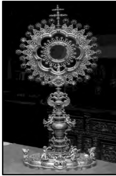
Fig.1. Custodia del Cabildo Catedral de Madrid. Desaparecida.