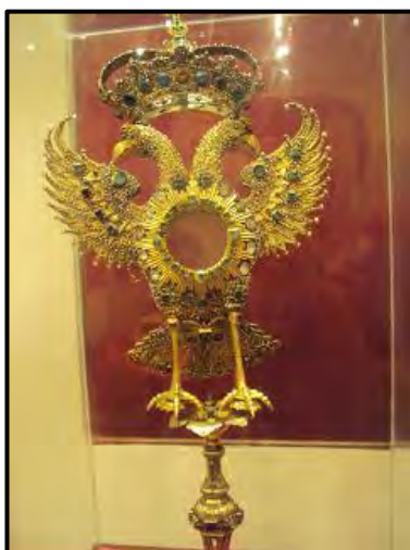
Fig.13 Custodia de la Catedral de Popayán. C. 1673.

fecha que se ha aceptado hasta ahora para la custodia de Popayán es 1673, anterior de todos modos a cualquiera de los ejemplos conocidos en España. 85 A Marta Fajardo que estudió la custodia de Popayán, le fue sugerida la posible influencia del grabado de María Eugenia de Berr de 1640 y aceptó que “de allí probablemente lo tomaron los plateros madrileños y pronto este modelo hizo eco en los virreinos de la Nueva España y del Perú, y tal como lo vemos en Nueva Granada”. Fue a la inversa. Como también (aunque quede planteado como hipótesis a comprobar) fueron excéntricos los modelos de las custodias del Escorial y de las Agustinas de Salamanca, quizá originalmente relicarios italianos intervenidos para convertirlos en fantásticas custodias. Como una persona, un objeto puede tener muchas biografías y algunos de los acontecimientos de éstas, transmiten significados sutiles, que ameritan ser interpretados culturalmente. “Las respuestas culturales a tales detalles biográficos revelan una masa intrincada de juicios estéticos, históricos e incluso políticos, y de convicciones y valores que dan forma a nuestras actitudes hacia los objetos etiquetados como arte”. 86